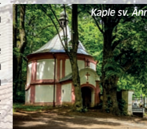
Kaple sv. Anny

Pět kilometrů dlouhá naučná stezka Žďár se dvěma nástupními místy, u zámku Lázeň a u kaple sv. Anny. Provede vás půvabnou lokalitou kolem vrchu stejného jména a klidným prostředím zdejšího lesoparku. Na patnácti zastaveních se dozvíte zajímavosti o zdejší fauně a flóře. Trasa vede po upravených cestách, nenáročným terénem.