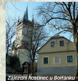
Zájezdni hostinec u Bolfánku

Rozhledna zde byla zřízena již roku 1845, kdy byla věž dostavěna do výšky 45 metrů a tesařským mistrem Janem Kubátem změněna do nynější podoby. Na vrchol věže vede 138 schodů. Odměnou za vynaloženou námahu při výstupu na vrchol rozhledny je nezapomenutelný dokonalý kruhový výhled na panorama Šumavy, vrcholy Českého lesa, lze spatřit také Radyni, Plzeň a Brdy a při dobré viditelnosti i Krušné hory a vrcholky Alp.