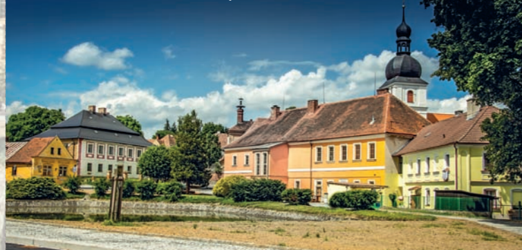
Zrekonstruované centrum městyse s kostelem

V presbytáři jsou také vymalovány erby s bohatými farními prvky ze 16. století. Vlevo je starší podoba erbu Czerninů, vedle erby Kateřiny z Vopisku a Elišky z Opálky. Rákosový strop lodi obdélníkového tvaru je pokryt freskou od V. Kaplanka z Domažlic z roku 1759. Při severní stěně je před pozadím freskové iluzivní malby osazeno dřevěné sousoší Kalvárie z roku 1759, od stejného sochaře je polychromovaná plastika sv. Jana Nepomuckého.