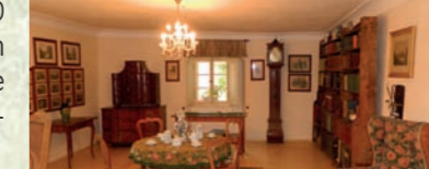
Interiér Starého czerninského zámku

Po zabavení majetku v roce 1945 zde byly kanceláře Lesního úřadu i byty zaměstnanců. Kolem roku 1948 byl zámek převeden do majetku obce Chudenice pro kulturní účely. Bylo sem převedeno Muzeum Josefa Dobrovského z rozhledny Bolfánek, bylo zbudováno kino, knihovna, kuchyně JZD Chudenice, klubovna SSM, dále obecní byty a další. V roce 2000 se zde zbudovala v prvním patře zámecká expozice a v přízemí expozice muzejní.