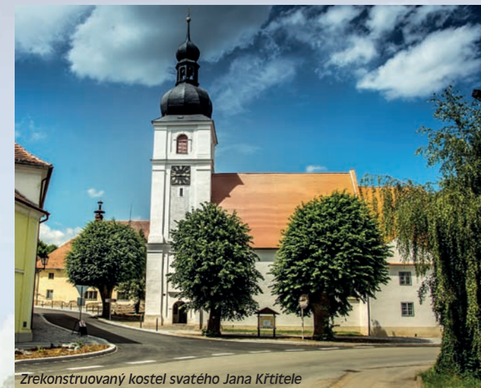
Zrekonstruovaný kostel svatého Jana Křtitele

Historickému centru Chudenic dominuje gotický farní kostel svatého Jana Křtitele. Podle nápisu na stěně kostela je v roce 1200 založil Drslav, bratr Czernina a Břetislava z Chudenic. První dochovaná písemná zpráva o Chudenicích však pochází až z roku 1291 a kostel byl zřejmě založen po postavení sousední tvrze – rodového sídla Czerninů (Starý zámek).