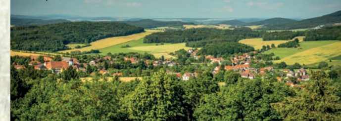
Dnešní pohled na Chudenice z Bolfánku

Když se o této události dozvěděl vévoda Břetislav, nazval malé miminko černé od sazí černým, tedy Czerninem a statky jeho rodičů pojmenoval Chudenicemi.