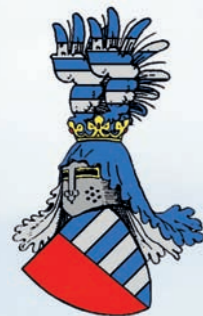
Starý rodový erb Černinů z Chudenic

Chudenice jsou poprvé připomínány roku 1200, v době, kdy je prvně zmiňován kostel sv. Jana Křtitele v Chudenicích. Jejich historie je velmi úzce spjata se šlechtickým rodem Czerninů, kterým obec nepřetržitě patřila od první poloviny 13. století do roku 1945.