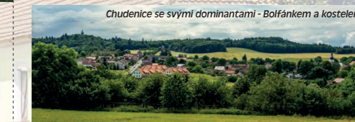
Chudenic se svými dominantami - Bolfánkem a kostelem