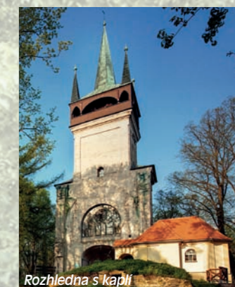
Rozhledna s kaplí

Dominantou Chudenicka viditelnou z daleka je rozhledna Bolfánek, která se nachází na nejvyšším vrcholu lesa Žďár (583 m n.m.). Věž je pozůstatkem kostela svatého Wolfganga, též název Bolfánek, je počestvou zdrobnělinou jména Wolfgang.