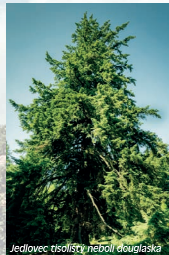
Jedlovec tisolistý neboli douglaska

Zahrada byla založena v roce 1828 hrabětem Eugenem Černinem jako školka okrasných, převážně severoamerických dřevin. Vznik arboreta je datován do roku 1842. Pod jménem Americká zahrada je arboretum známé od roku 1844 a díky své zachovalosti, stáří a přítomnosti některých zajímavých forem dřevin se jedná o jednu z nejvýznamnějších památek svého druhu u nás. Je to nejucelenější soubor introdukovaných, převážně severoamerických dřevin na území České republiky, čítající více než 200 druhů a kultivarů listnatých i jehličnatých dřevin evropského, asijského a severoamerického původu. V roce 1843 zde byl poprvé vysazen jedlovec tisolistý (Pseudotsuga menziesii) neboli douglaska, který je obvykle nesprávně označován jako douglaska tisolistá. Tento exemplář se nám zachoval do současnosti. Dle posledního měření, které proběhlo v květnu 2010 je